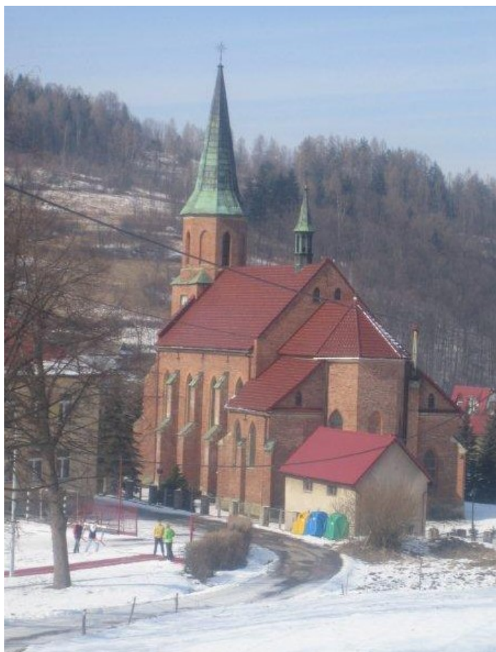
Zdjęcie 3. Kościół Parafialny Św. Anny w Stryżawie