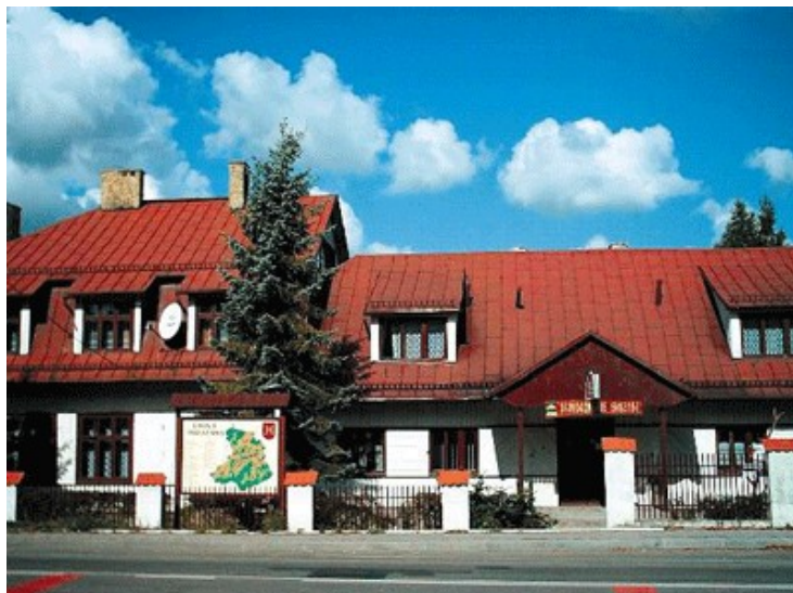
Zdjęcie 12. Gminny Ośrodek Kultury w Stryszawie