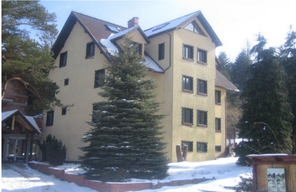
Zdjęcie 5. Ośrodek rekolekcyjny Księża Zmartwychwstańców