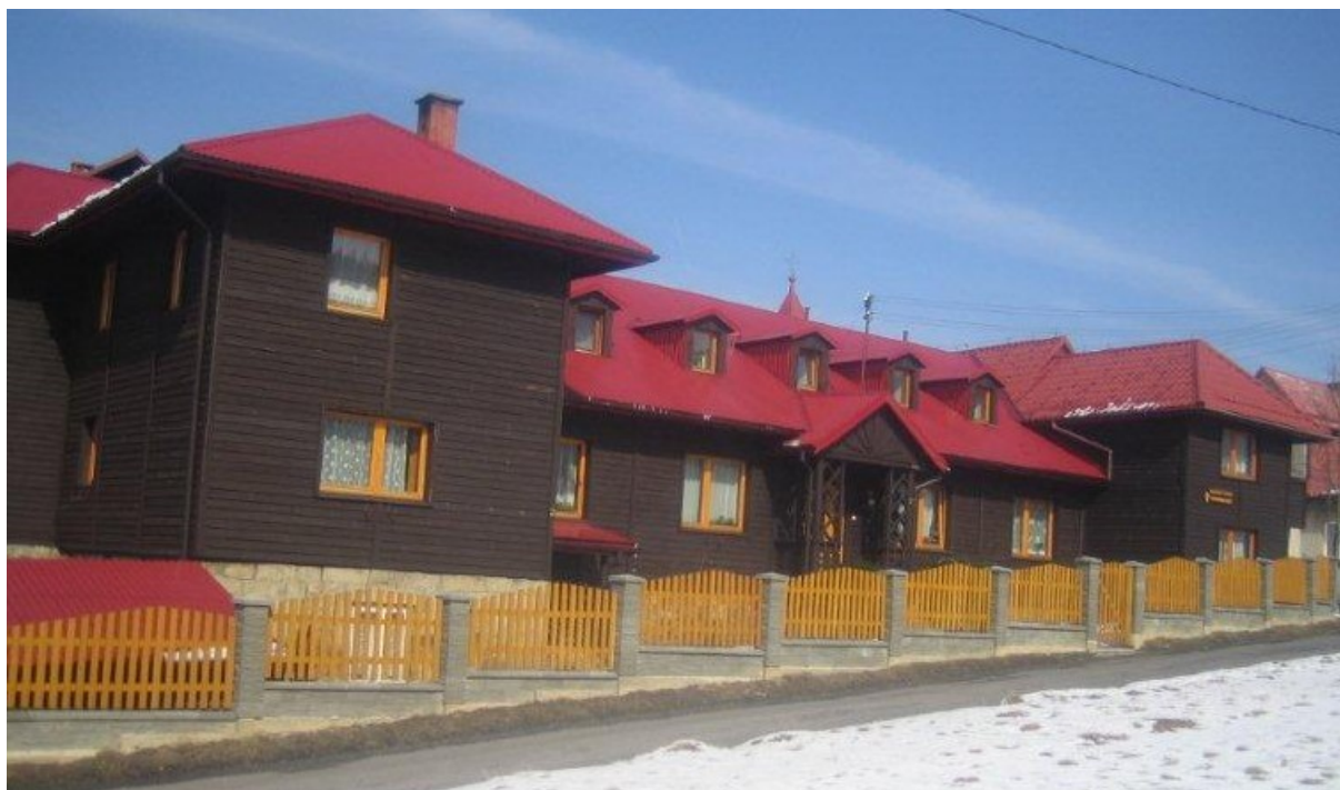
Zdjęcie 4. Klasztor Sióstr Zmartwychwstanek na Siwcówce