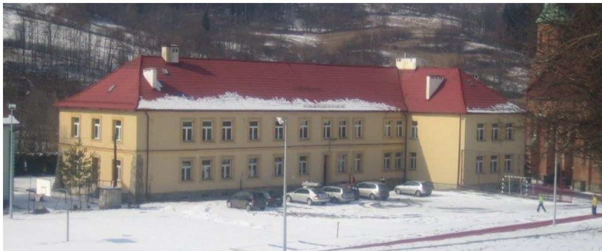
Zdjęcie 9. Gimnazjum nr 1 im. Tadeusza Kościuszki w Stryszawie