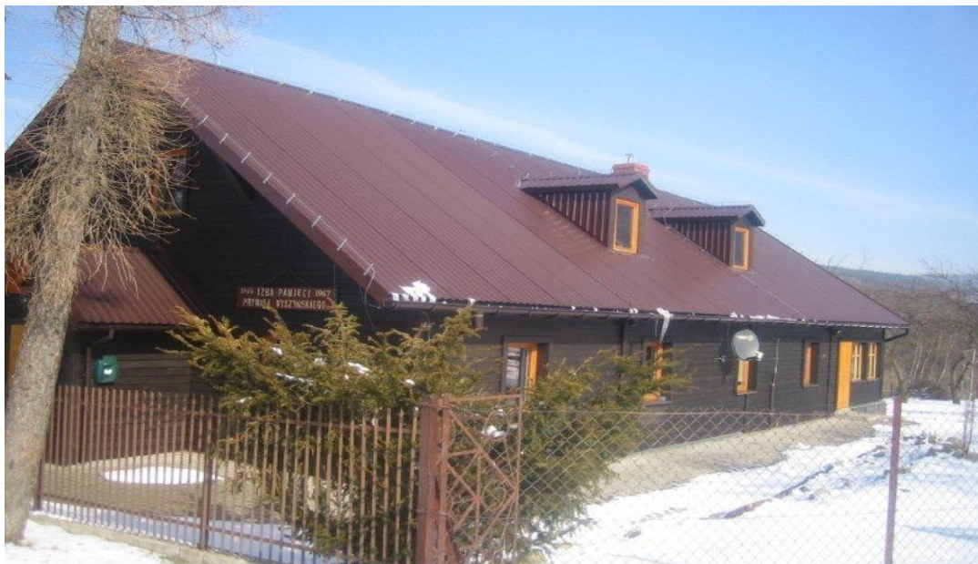
Zdjęcie 6. Kapelanówka z Izbą Pamięci Prymasa Stefana Wyszyńskiego

Obok klasztoru znajduje się drewniany domek, tzw. Kapelanówka z Izbą Pamięci Prymasa Stefana Wyszyńskiego.