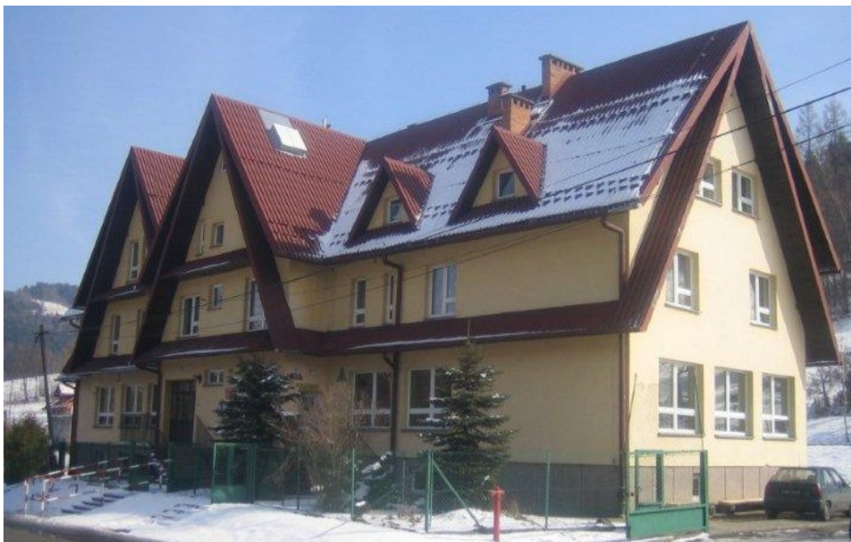
Zdjęcie 8. Szkoła Podstawowa nr 3 im. Lecha Wałęsy ze Szkolnym Schroniskiem Młodzieżowym