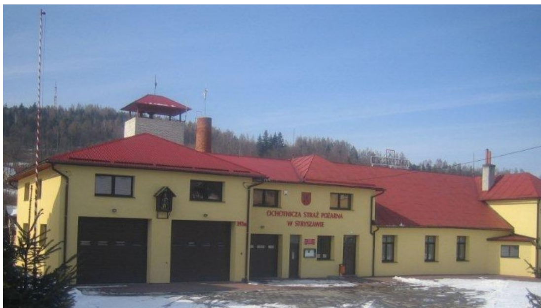
Zdjęcie 15. Budynek OSP w Stryżawie

Młodzież OSP regularnie uczestniczy w rajdach organizowanych przez PSP Sucha Beskidzka, w konkursach OTWP w którym zajmuje czołowe miejsca na szczeblu gminnym, powiatowym, a nawet wojewódzkim. Bierze także czynny udział w Gminnych Zawodach Sportowo – Pożarniczego.