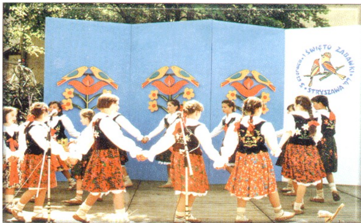
Zdjęcie 16. Święto Zabawki Ludowej.