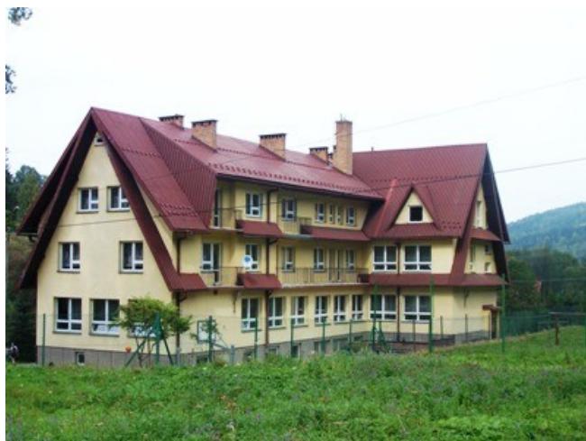
Zdjęcie 11. Szkolne Schronisko Młodzieżowe "Pod Jałowcem"