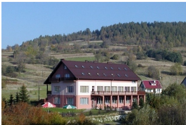
Zdjęcie 13. Ośrodek szkoleniowo-rekreacyjny GRON

– 40 miejsc noclegowych w pokojach 2- i 4- osobowych oraz apartamentach. W restauracji można zamówić śniadania, obiady i kolacje. Oferowane smaczne dania kuchni polskiej.