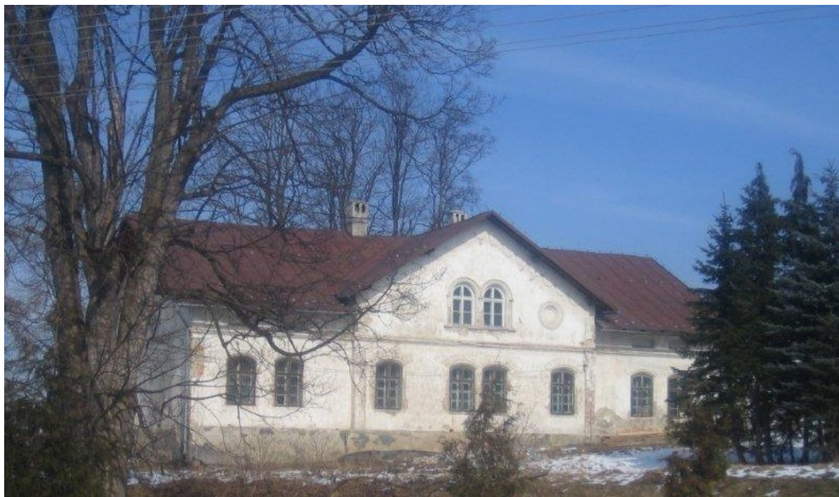
Zdjęcie 2. Dworek Zabytkowy Leśniczówka - adaptowany obecnie na GOK