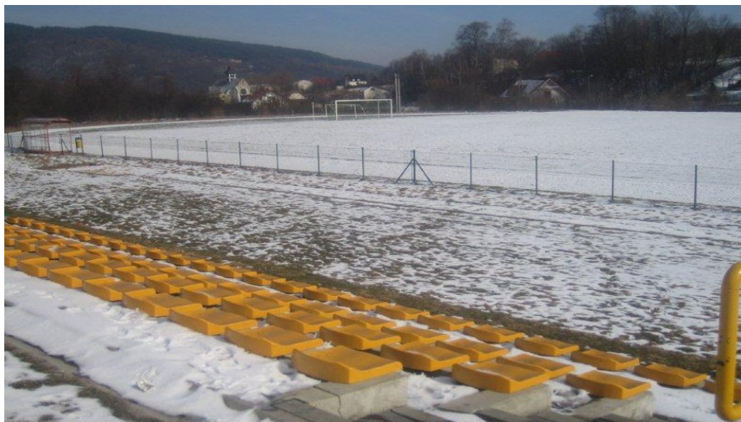
Zdjęcie 14. Boisko sportowe do piłki nożnej z bieżnią w Stryszawie

Obecnie LKS Jałowiec zajmuje I miejsce w klasie A podokręgu Wadowice.