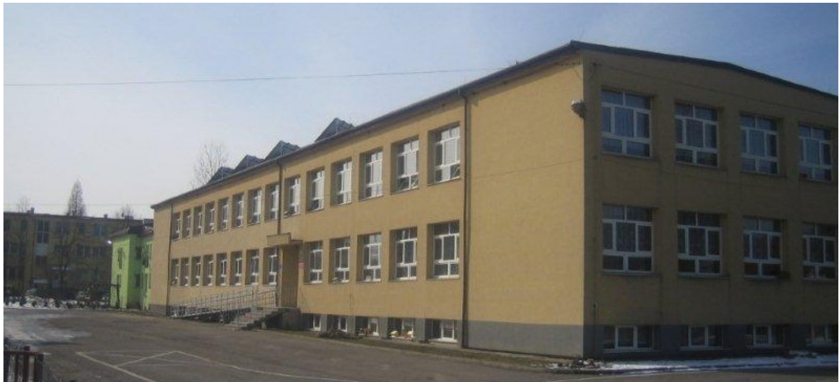
Zdjęcie 7. Szkoła Podstawowa nr 2 im. ks Znamirowskiego